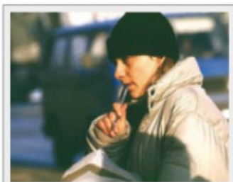
Maria Grazia Cutuli in Bosnia nel 1988

Tre anni di ricerche, decine di interviste e un minuzioso lavoro di indagine. Il documentario «Maria Grazia Cutuli - Il prezzo della verità» ricostruisce con materiali inediti la vita privata, professionale e le circostanze dell'omicidio dell'inviata del Corriere della Sera,